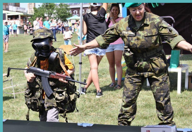
Obr. 4: Dětský den organizovaný radnicí městské části Brno-Medlánky.

Vývozy zbraní nejsou jediným problematickým aspektem současného vztahu české společnosti k militarismu – dalším je militarizace ve vzdělávání. Dětem jsou předkládány vojenské operace vedené se zbraněmi v rukou jako běžná součást průběhu konfliktů. Mírová řešení konfliktů tak mohou být upozaděna.