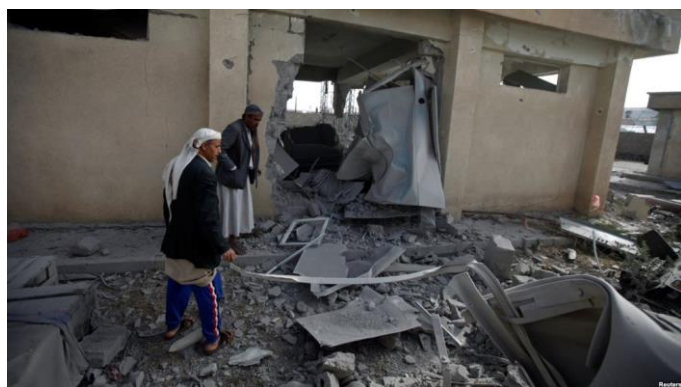
Obr. 3: Následky bombardování saúdským letectvem.

I navzdory tomu, že k embargu na Saúdskou Arábii vyzval Evropský parlament již v roce 2016, Česká republika ještě v roce 2017 této monarchii vyvezla zbraně a vojenský materiál v hodnotě 28 milionů eur. Za posledních pět